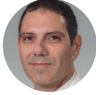
DR. GEORGE THERAPONDOS OCHSNER CLINIC