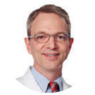
DR. JAMES TROTTER Estados Unidos