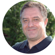
DR. RAMÓN BATALLER Estados Unidos